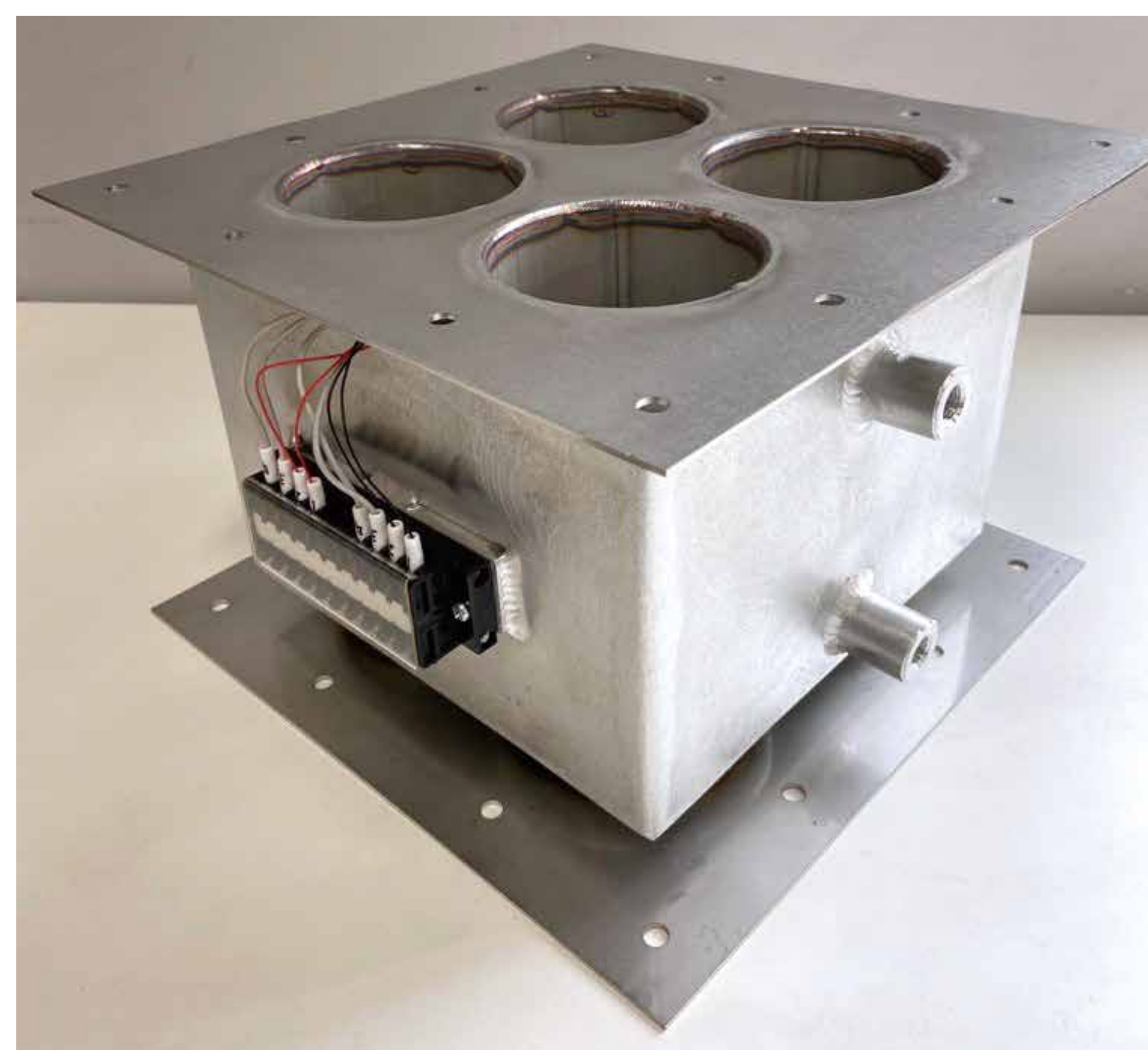
図2 熱電発電ユニット