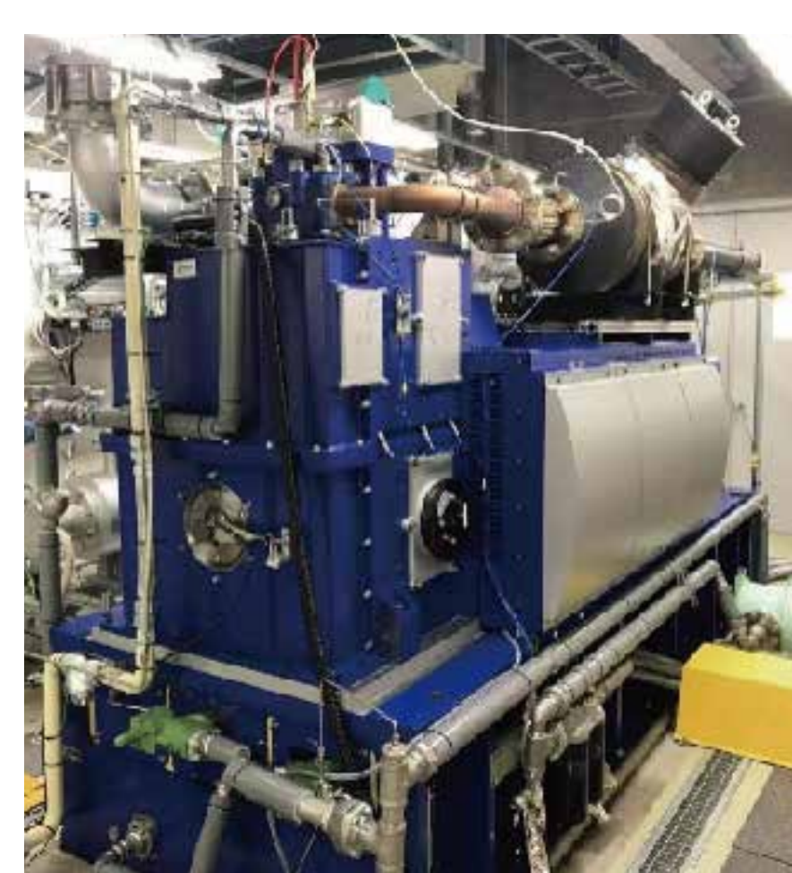
単気筒試験機システム