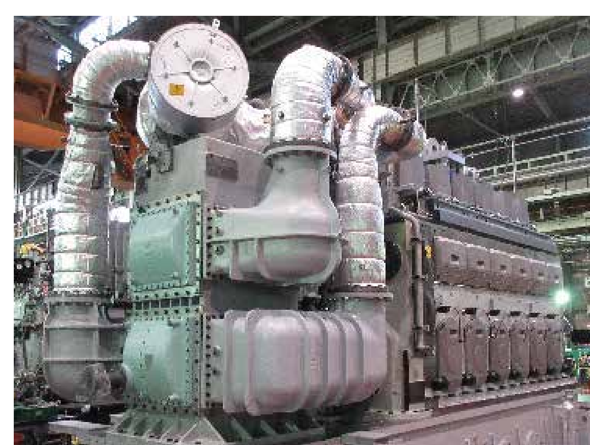
2MWクラス実証試験機 (6気筒)