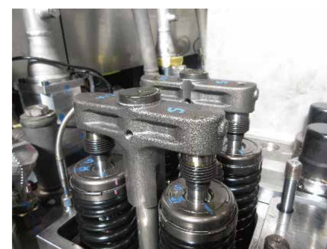
弁隙間自動調整装置 HLA(Hydraulic Lush Adjuster)