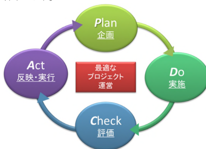
図1 研究開発マネジメントサイクル概念図

NEDO では研究開発マネジメントサイクル（図1）の一翼を担うものとして制度評価・事業評価を位置付け、評価結果を被評価事業等の資源配分、事業計画等に適切に反映させることにより、事業の加速化、縮小、中止、見直し等を的確に実施し、技術開発内容やマネジメント等の改善、見直しを的確に行ないます。