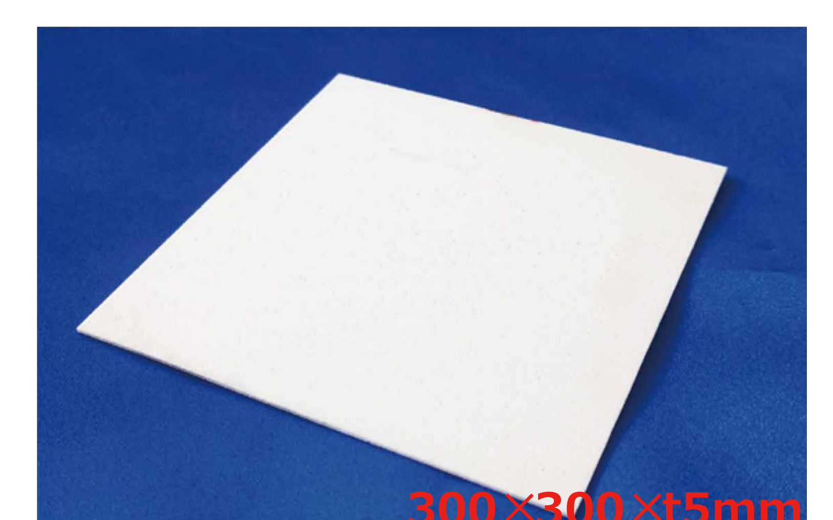
ファイバーレス断熱材 (ボード形状)