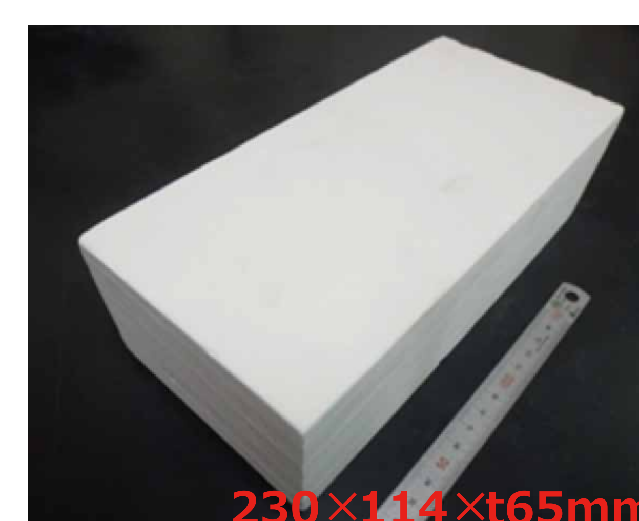
ファイバーレス断熱材 (並形れんが形状)