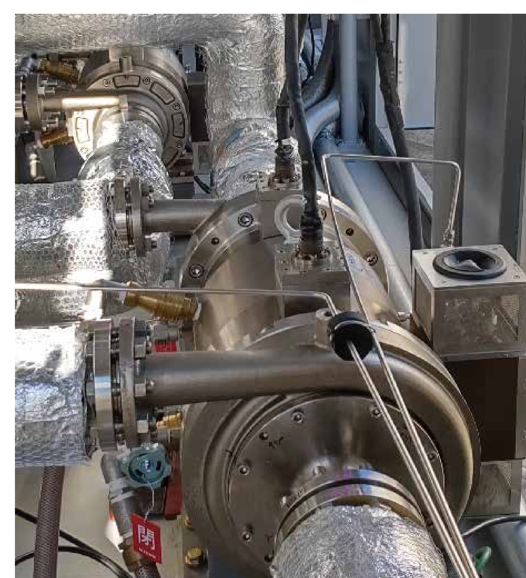
図3 専用オイルフリーターボ圧縮機 (手前:第1第2圧縮機、奥:第3第4圧縮機)