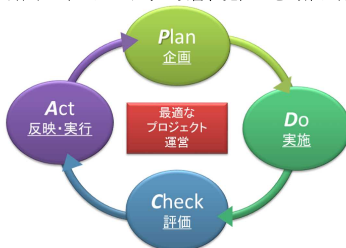
図 1 研究開発マネジメントサイクル概念図

NEDO では研究開発マネジメントサイクル（図 1）の一翼を担うものとして制度評価・事業評価を位置付け、評価結果を被評価事業等の資源配分、事業計画等に適切に反映させることにより、事業の加速化、縮小、中止、見直し等を的確に実施し、技術開発内容やマネジメント等の改善、見直しを的確に行っていきます。